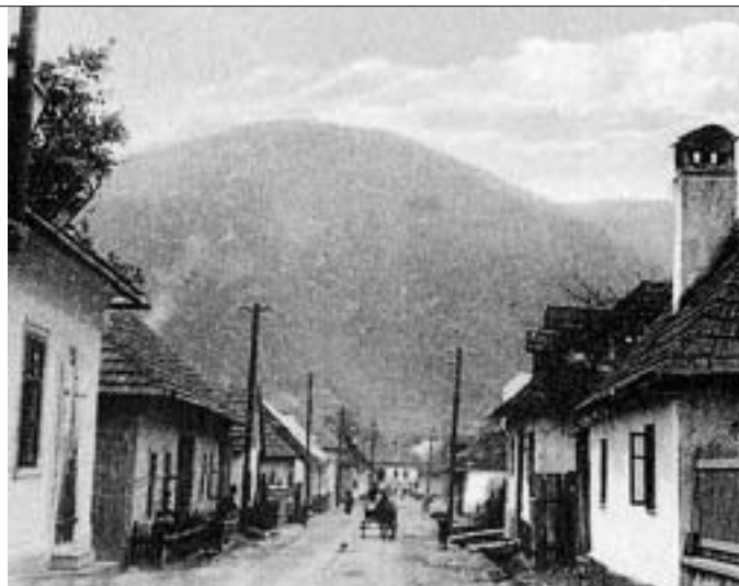
Ulica Na Dedine 30. roky 20. storočia

Históriu budeme zverejňovať autenticky, nebudeme do toho vstupovať, a preto niektoré pojmy a fakty budú dnes pre vás aj úsmevné.