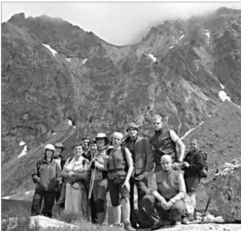
◀ Kôprovský štít