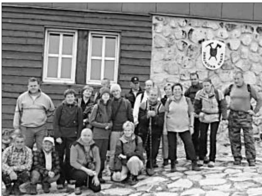
◀ Zbojnícka chata