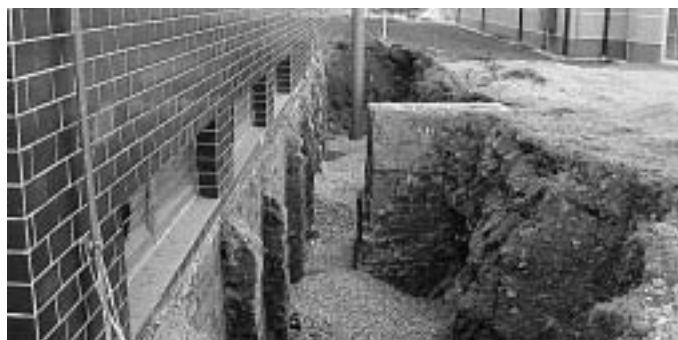
Oprava statiky budovy školy.