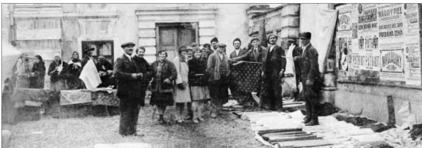
Čipkári z Brusna a Sv. Ondreja v Turčianskom Sv. Martine v roku 1928

Od západu k východu vedie krajinská cesta, na ktorej je čulá premávka, lebo je jedinou komunikačnou čiarou. V strede obce odbočuje od tejto cesta, ktorá vedie dedinou. Stavaná je asi pred 40 rokmi kvôli brus-