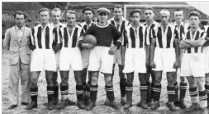
Mužstvo ŠK Ondrej v roku 1939.