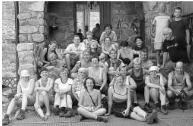
Oddych pred Brnčalovou chatou

22. júla 2007 – Vysoké Tatry – Jahňací štít: Zo zástavky Biela Voda sme sa za slnečného počasia vydali zdolať ďalší tatranský štít. Náš prvý oddych bol na Brnčalovej chate pri Zelenom plese a po ňom nás čakal najťažší cieľ – Jahňací štít. Slniečko pripekalo a nám sa do strmého svahu kráčalo ťažko, no chuť stať na štíte prekonala únavu. Z chodníka sa naskytl pohľad na stáda kamzíkov pasúcich sa len pár metrov od nás. Pod hrebeňom sme zdolali reťaze, prešli cez skalné rebro stúpajúc hore na južný hrebeň a cez sutinový terén až na vrchol. Jahňací štít (2230 m n.m.) je uzlovým bodom štyroch horských hrebeňov a zároveň posledným štítom východnej časti Vysokých Tatier.