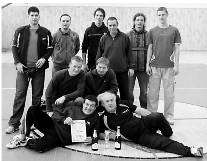
3. miesto – OVK Brusno