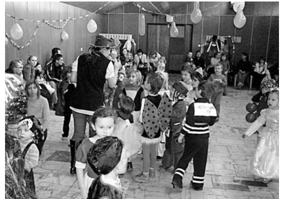
▲ ▲ Karneval