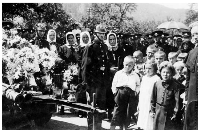
Vysvätenie motorovej striekačky v Brusne v roku 1937

Dňa 31. decembra 1938 sa uskutočnilo sčítanie ľudu, podľa ktorého naša obec má 920 obyvateľov – 911 Slovákov, 4 Česi, 1 Rumun, 1 Nemeček, 3 Maďari.