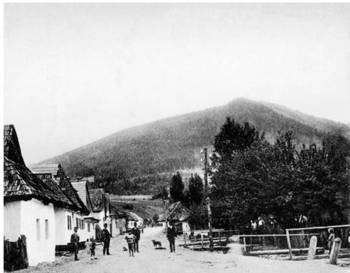
Kúpeľná ulica v roku 1927

Históriu budeme zverejňovať autenticky, nebudeme do toho vstupovať, a preto niektoré pojmy a fakty budú dnes pre vás aj úsmevné.