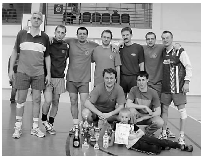
1. miesto – VK 40 Brezno