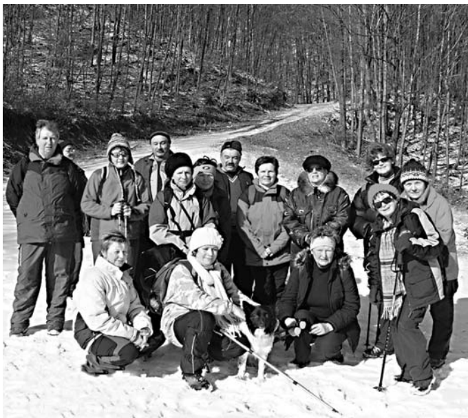
Túra na Bániky

Naša prvá túra podľa plánu TO Ondrobrus na Hrb sa uskutočnila 6. apríla. Hmlisté, k dažďu sa chýliace počasie neodradilo 10 turistov. Cez kúpele, Peklo, Starý majer sme prišli do snehom pokrytej krajiny ku Chate na Hrbe vo výške 1100 m.n.m. Po občerstvení sme zasneženou krajinou cez Letisko, Muráň križovatku, Kapusníská, Trosky zostúpili do Brusna.