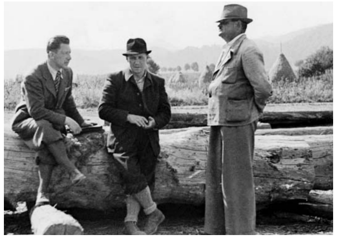
Srenitzerova píla v rokoch 1932–1937