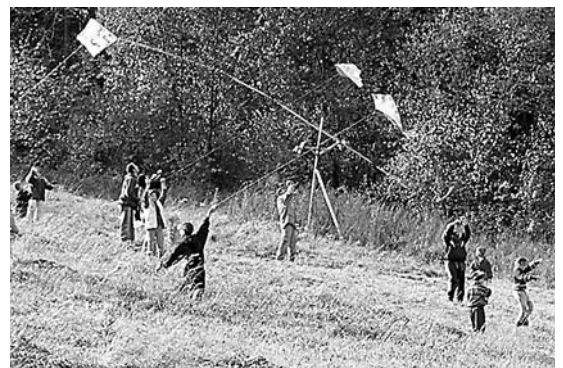
► Šarkaniáda pod Skalou