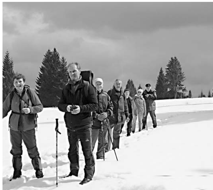
Túra na Hrb – apríl 2008